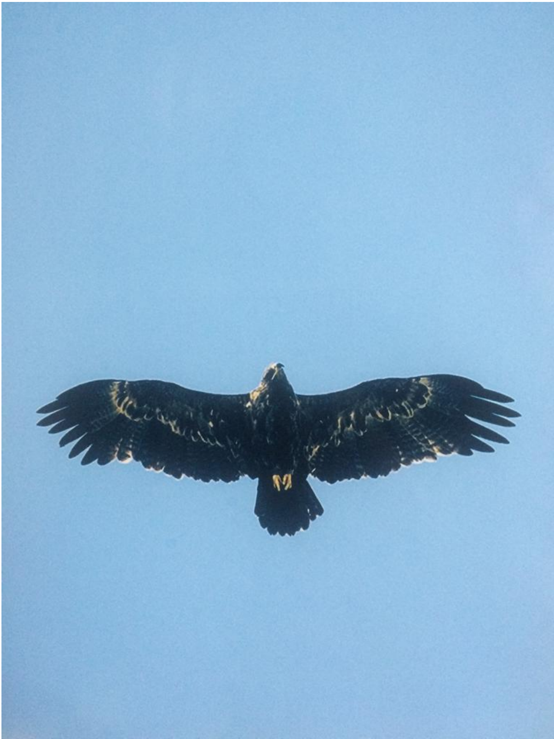
Фото «Горный орел» занявшее 1-е место, автор Омаров Рамазан, руководитель Магомедова А.Д.