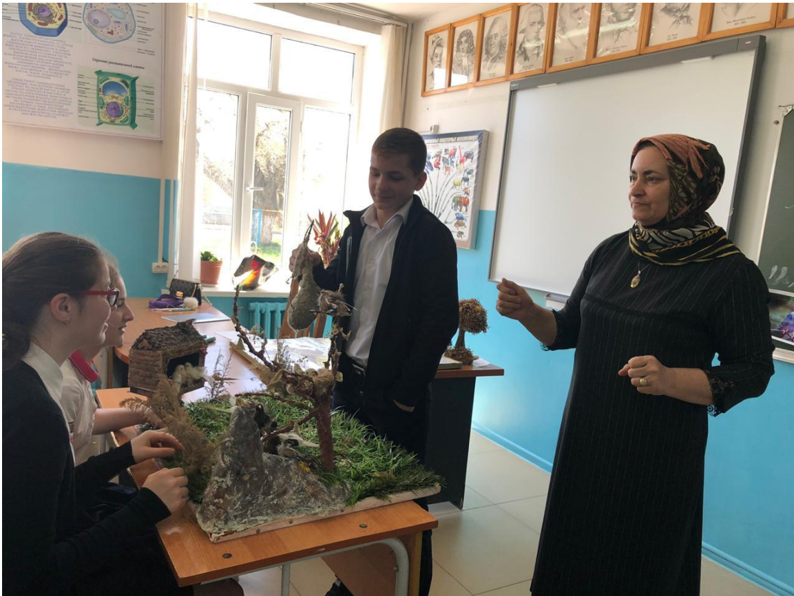
Учащиеся 6г класса работают над поделкой из природного материала.