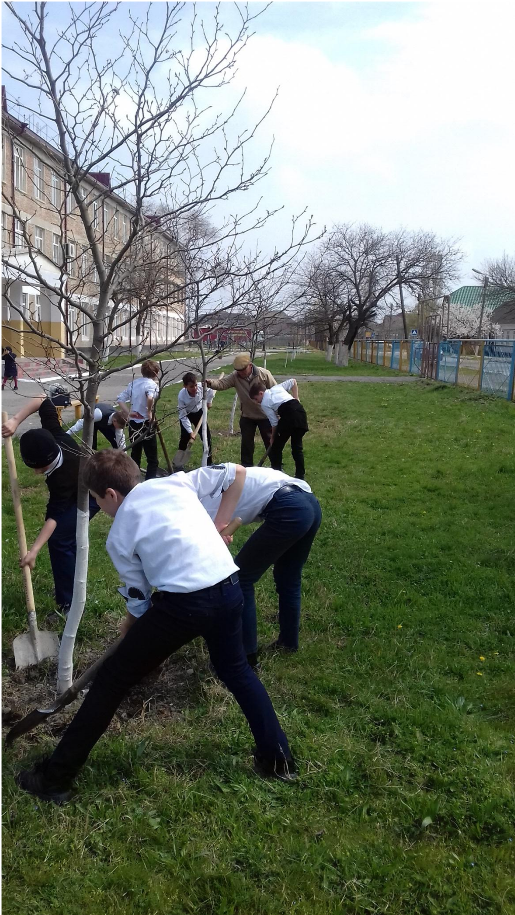
Учащиеся 6г класса на уроке технологии